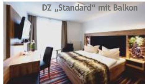
DZ „Standard“ mit Balkon