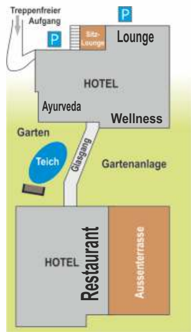
Lageplan Hotel Restaurant Am Eichenberg