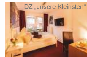
DZ „unsere Kleinsten“